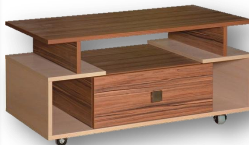
Стол журнальный ШхГхВ, мм (800х600х600) (материал – ЛДСП)