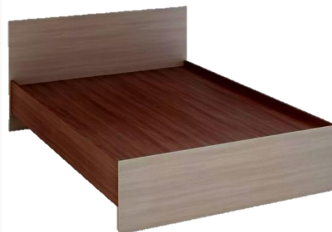
Кровать ДхШхВ, мм (1800х2000х 600) (материал – ЛДСП)