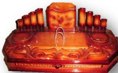
Набор для письменных принадлеж- ностей (материал - сосна)