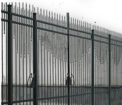
Ограждение металлическое (размеры: высота - от 2 м, расстояние между вертик. стойками – от 0,01 м)