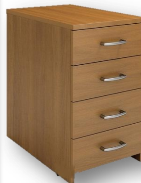
Тумба офисная на 4 ящика (материал – ЛДСП)