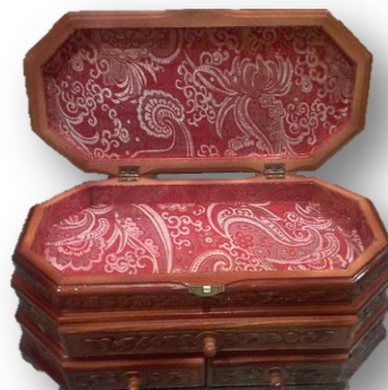
Шкатулка (материал - сосна)