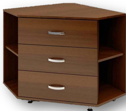
Тумба угловая ШхГхВ, мм (800х400х600) (материал – ЛДСП)