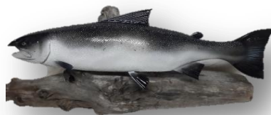
Рыба (материал - сосна)

- Сувенирная продукция различных размеров, тематики