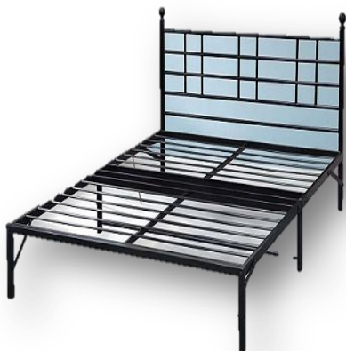
Кровать металлическая (размеры (м): 2,0x1,0)

- Продукция для бытового использования, сувенирная продукция