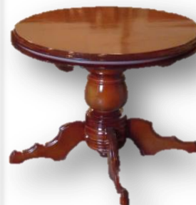
Журнальный стол (материал – сосна)