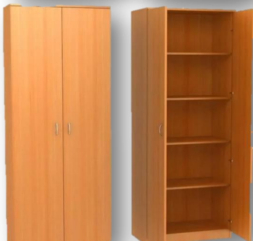
Шкаф (материал – ЛДСП)