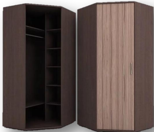
Шкаф угловой (материал – ЛДСП)