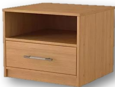
Тумба ШхГхВ, мм (400х400х600) (материал – ЛДСП)