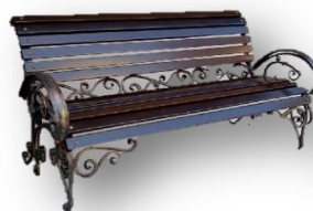
Скамейка (материалы: металл, массив сосны)