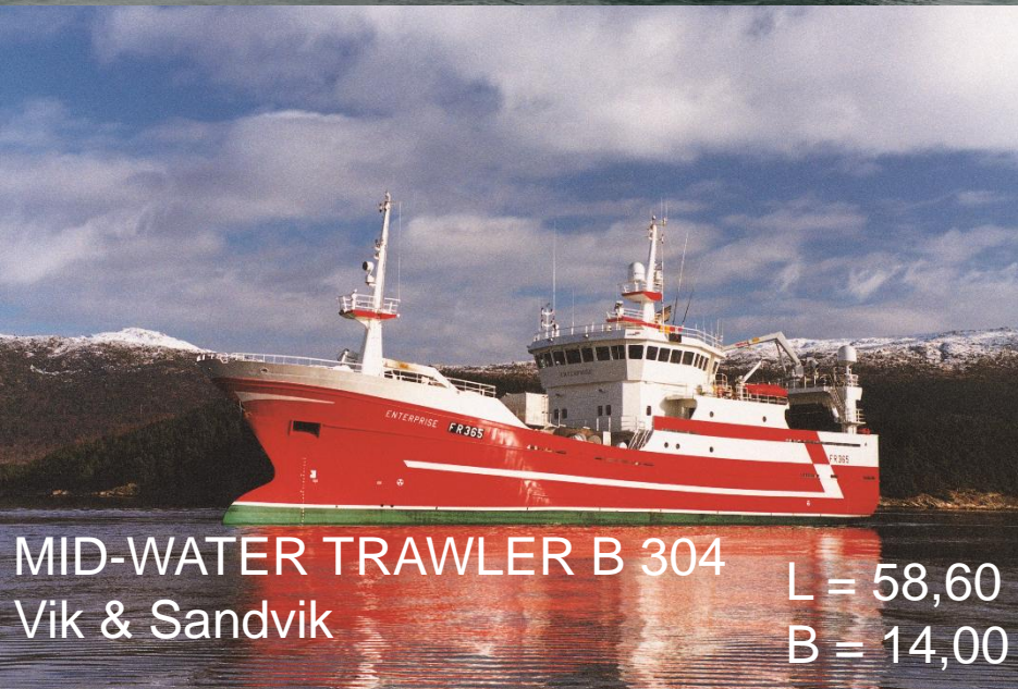
MID-WATER TRAWLER B 304 Vik & Sandvik