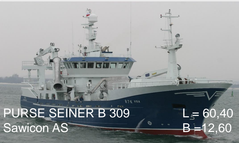
PURSE SEINER B 309 Sawicon AS