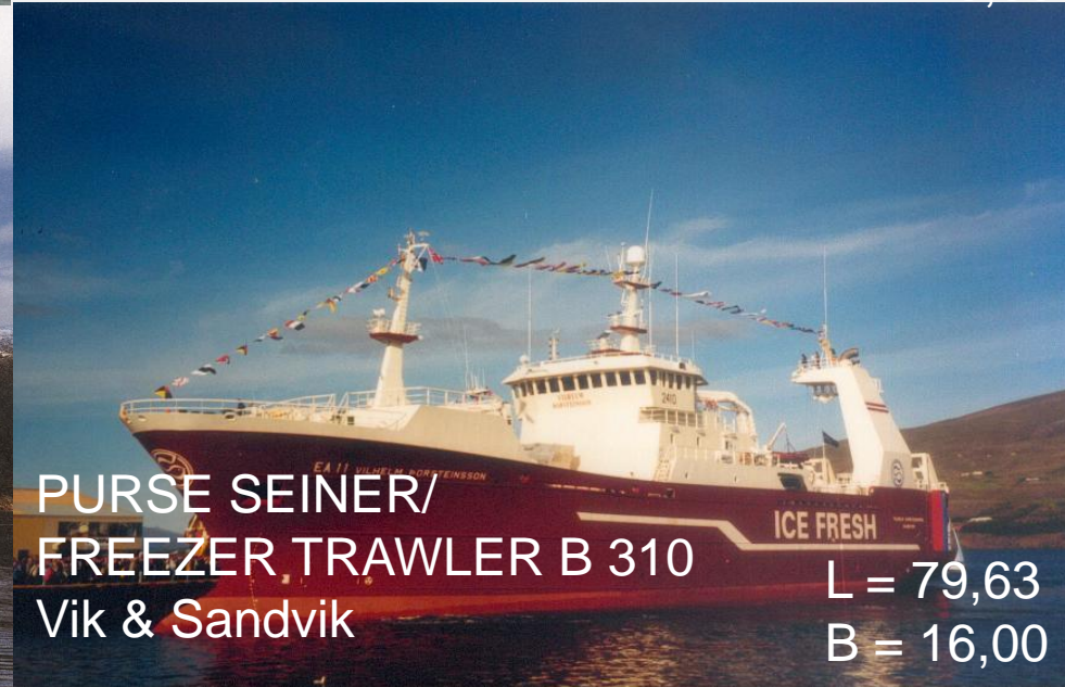
PURSE SEINER/ FREEZER TRAWLER B 310 Vik & Sandvik